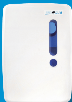
blanc 2301 002 500 99