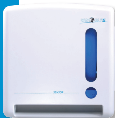
blanc 2101 000 500 99