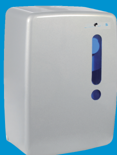
argent 2304 002 500 99