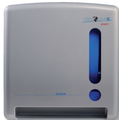
argent 2104 000 500 99